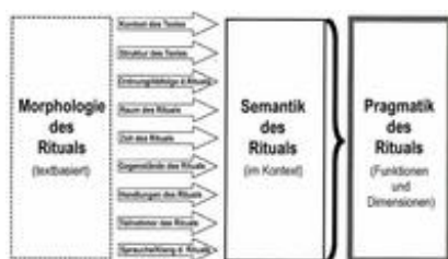
Abb. 1 Das Verstehen von Ritualen.

Biblische Rituale erscheinen in Texten, die in Hebräisch, Aramäisch oder Griechisch verfasst worden sind. Sprache ist immer eng mit Struktur verbunden, und um Rituale zu verstehen, muss die linguistische und literarische Struktur eines Ritualtextes verstanden werden. Allerdings kann Textsyntax nicht automatisch mit Ritualsyntax